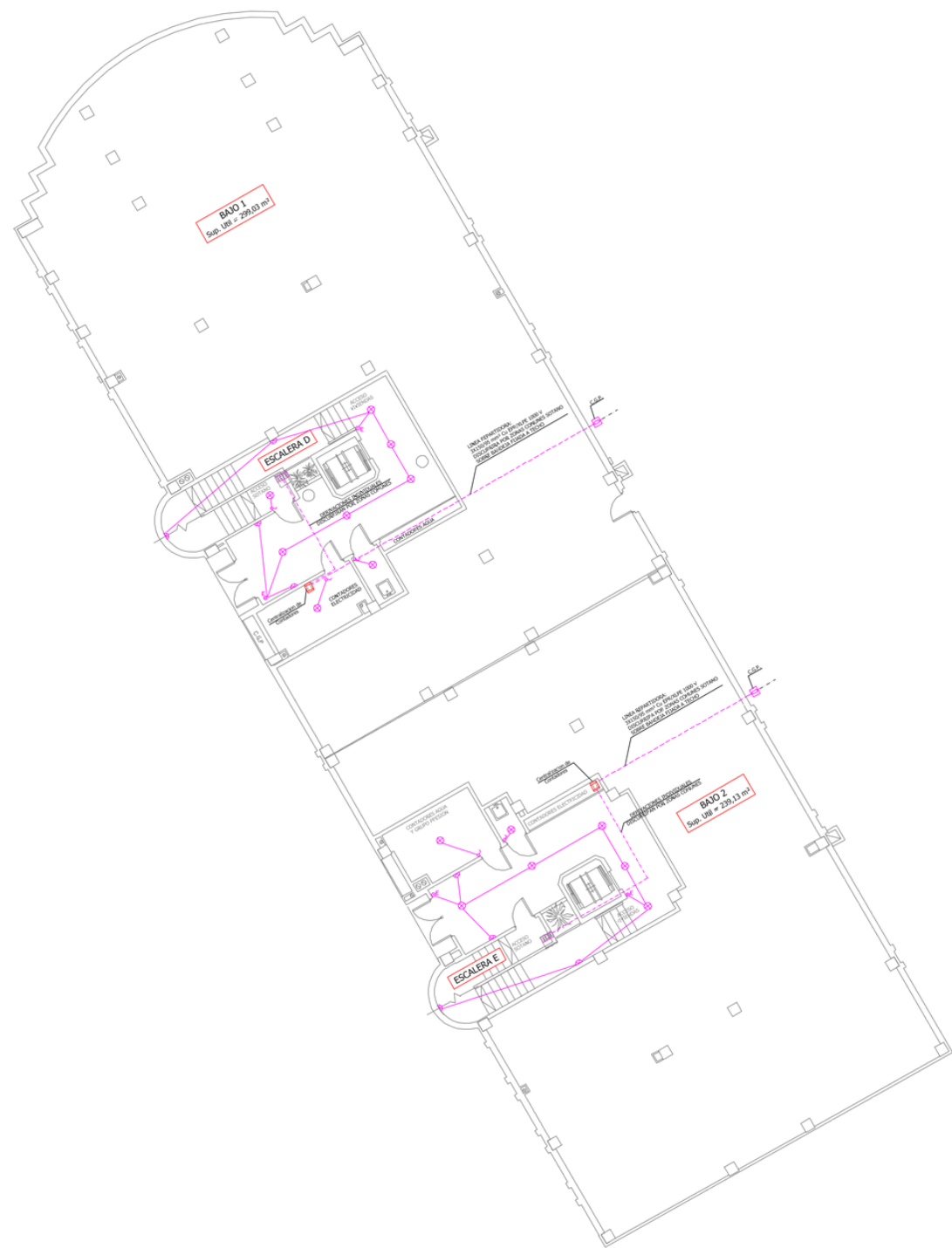
I.E.R.T. PLANTA BAJA